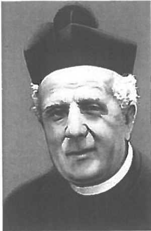
San Luigi Guanella (1842-1915)

Lo stile nel servire è quello praticato e insegnatoci dal fondatore Beato don Luigi Guanella. L'ambiente è caratterizzato da un clima di accoglienza, di fiducia e di benevolenza e ogni ospite vi trova attenzione, affetto e rispetto della propria dignità di persona.